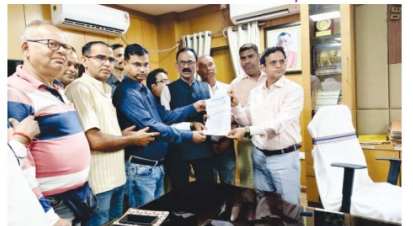
پریس کلب کے صدر اور پریس کلب کے افسران نے گورنر کے نام ڈی سی کو میمورنڈم پیش کیا۔

پریس کلب کے صدر اور پریس کلب کے افسران نے گورنر کے نام ڈی سی کو میمورنڈم پیش کیا۔ صحافیوں نے کہا کہ مارپیٹ کے خلاف پریس کلب کا احتجاج ہے۔