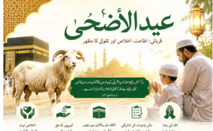
عید الاضحیٰ کی حقیقت اور ہماری ترجیحات کا بحران

اگر قربانی ہمیں اپنے اندر جھانکنے پر مجبور کر دے ہماری نیتوں کو صاف کر دے اور ہمیں اللہ کے قریب کر دے تو بھی اس کی اصل کامیابی ہے۔